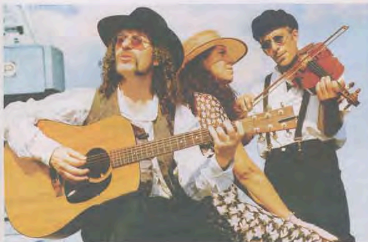
Brassens l'Irlandais, mercredi 12 octobre à la médiathèque de Pignan

les scènes int ou avec la « fi spectacle » cr (« Chispeand inspiré par ur pour un flam sous ses doig une pureté o traditionnell