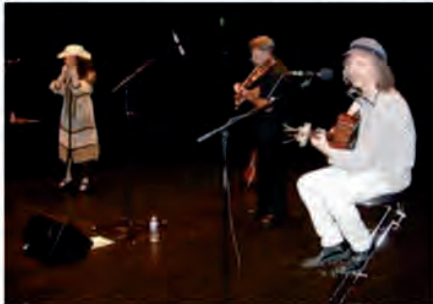
Les trois artistes ont enthousiasmé le public en mettant Brassens à la sauce irlandaise.

A la Saline de Soultz-sous-Forêts, vendredi soir, les amoureux de Georges Brassens ont pu découvrir un trio de musiciens et de chanteurs qui ont interprété les chansons du célèbre Sétois de manière fort originale.